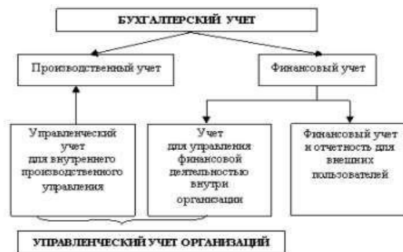
Рис. 1 – Взаимодействие финансового и управленческого учета